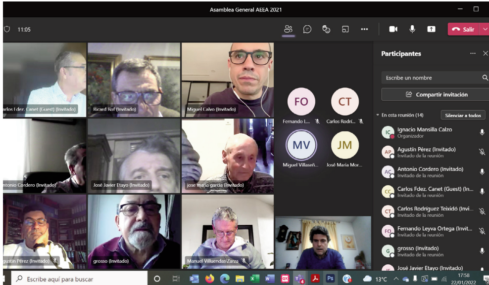
Otra imagen de los asistentes a la Asamblea.

España y récords mundiales y el trabajo de Españoles en el ranking mundial y europeo 2020 con un total de 184 páginas.