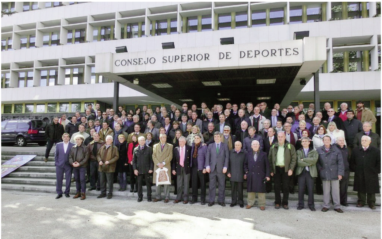
Cerca de 100 plusmarquistas españoles junto a autoridades y miembros de la AEEA posando tras la presentación en el CSD del libro "Cronología de los récords y mejores marcas españoles de atletismo". Madrid, 6 febrero 2015