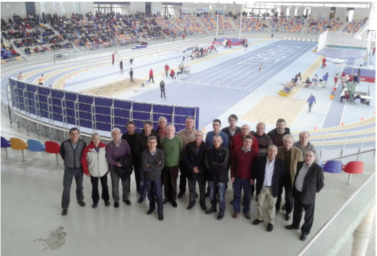
Asamblea de la AEEA 2013 celebrada en enero 2014 en Sabadell. En la imagen, gran parte de los miembros asistentes posando con la Pista Cubierta de Cataluña de fondo.