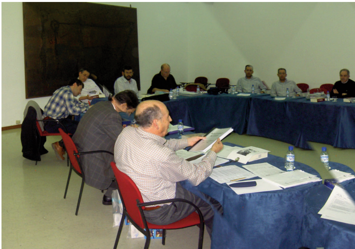
Panorámica de la Asamblea General correspondiente a 2005 y celebrada en enero 2006 en Vitoria.