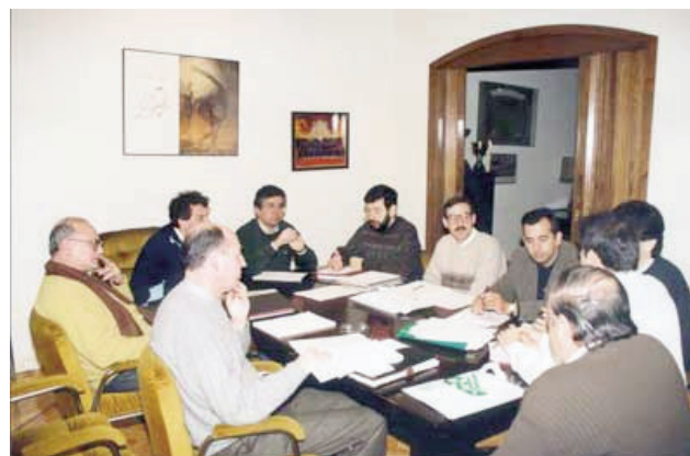
Asamblea AEEA 1995 en Madrid. Reunión del Comité Ejecutivo.