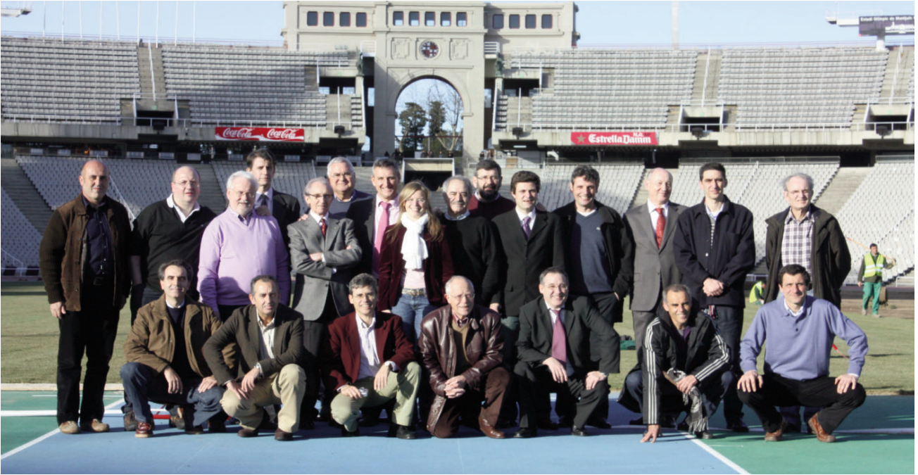
La Asamblea de 2009 (celebrado en enero de 2010) se celebró nada más y nada menos que en el Estadio Olímpico de Barcelona, un privilegio para la historia de la AEEA