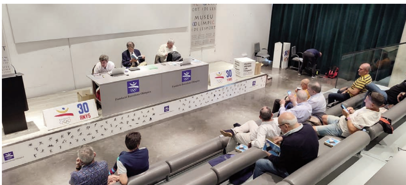
La Asamblea AEEA en octubre 2022 celebrada en el Museo olímpico de Barcelona.