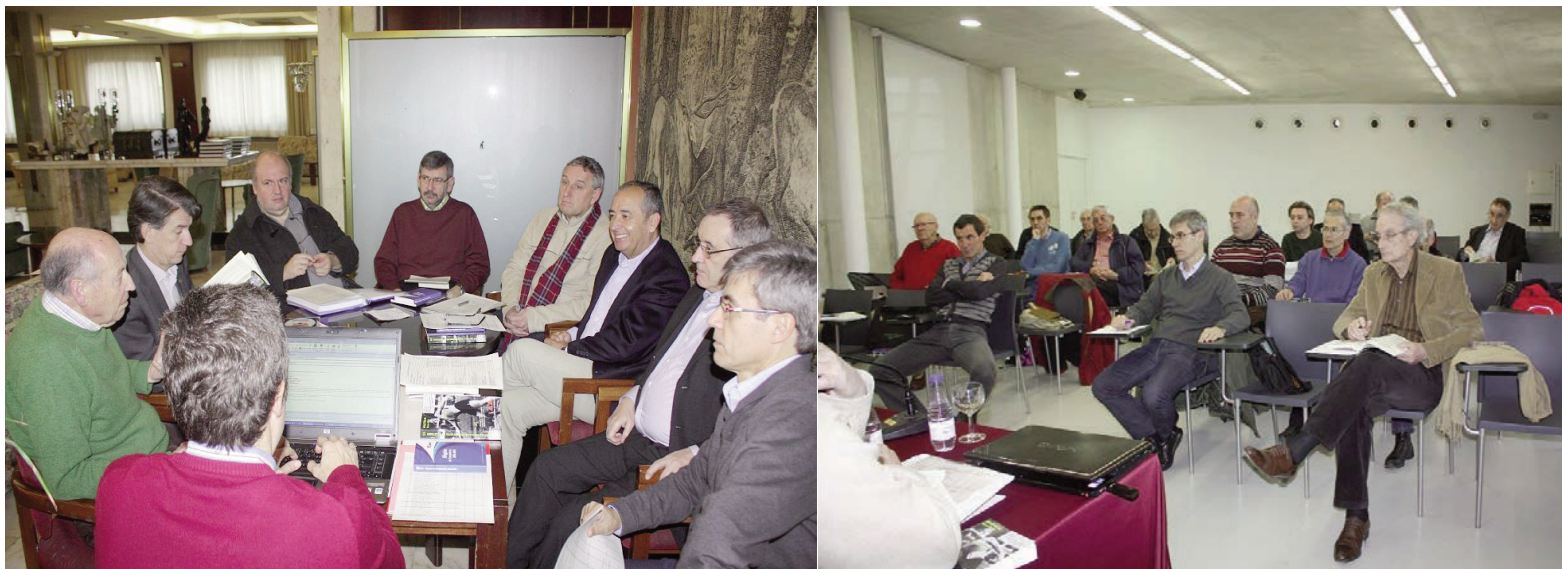
Asamblea General de 2013, celebrada en enero de 2014 en Sabadell. De arriba a abajo: reunión de Comité Ejecutivo, la sala de reunión con los miembros de la Asamblea y abajo, los componentes de la mesa presidencial: Tesorero, Presidente AEEA, Presidente de Honor y Secretario General.