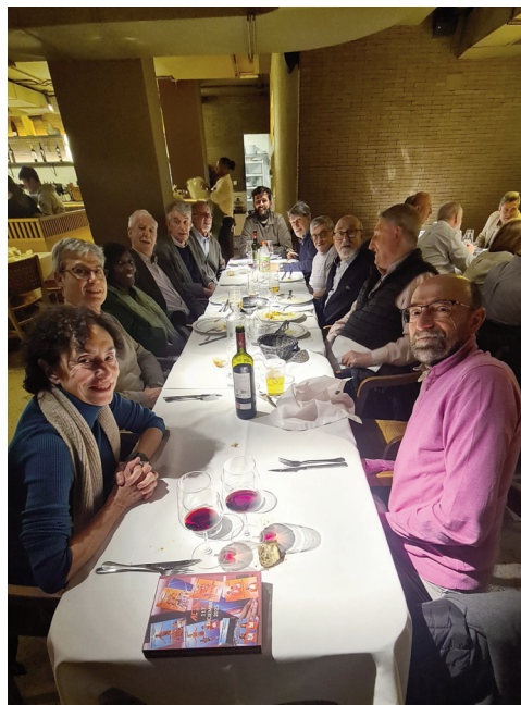
Dos imágenes de los asistentes a la cena en el restaurante Caná de Pozuelo de Alarcón.