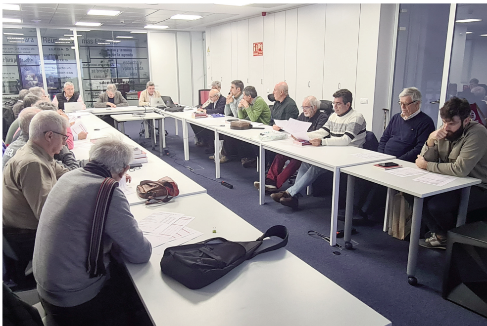
La Asamblea contó con una amplia representación de miembros y se celebró por primera vez en la nueva sede de la RFEA en la Ciudad de la Imagen (Pozuelo de Alarcón).