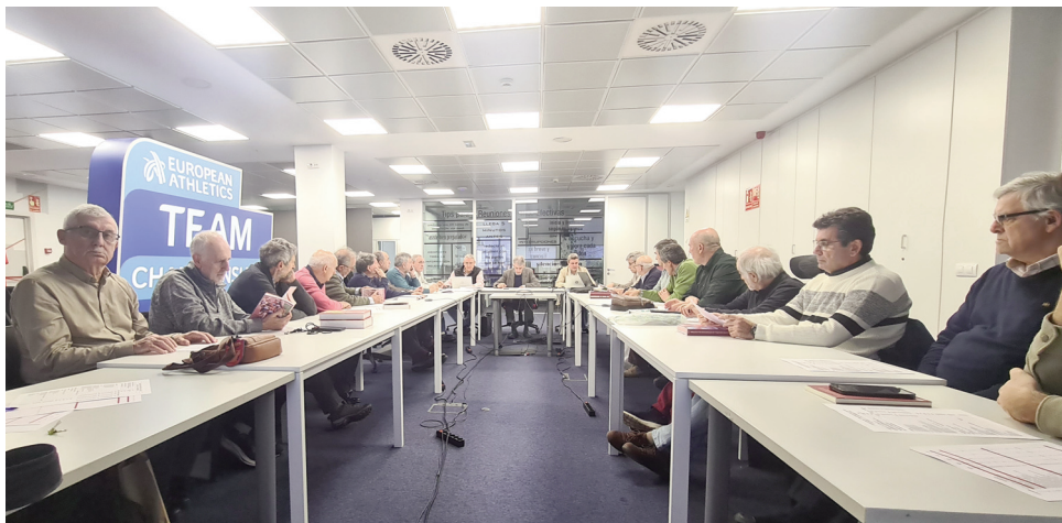
Panorámica de los asistentes a la Asamblea en la nueva sala de reuniones de la sede federativa.

plementar para cumplir con la normativa vigente en la materia.